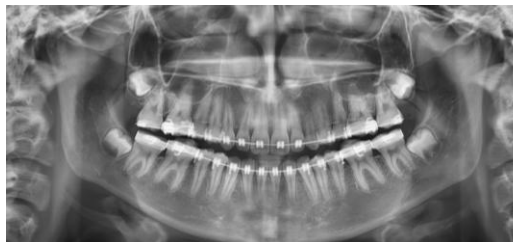
Figura 7. Radiografía panorámica de avancé.