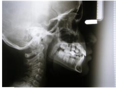
Figura 4. Radiografía lateral de cráneo inicial.