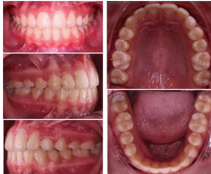
Figura 8. Fotografías intraorales finales.