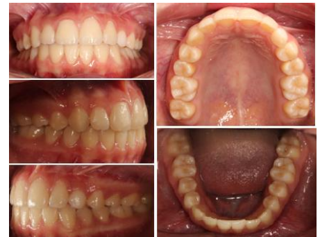
Figura 9. Fotografías intraorales 1 año después de finalizar el tratamiento.