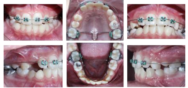
Figura 5. Inicio del tratamiento.