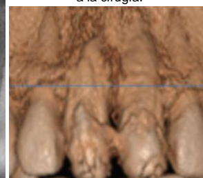
Figura 6. CBCT inmediato a la cirugía.