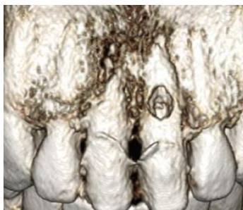
Figura 2. CBCT inicial donde se observa la reabsorción del OD 21.