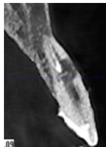
Figura 3. Corte sagital donde se observa la reabsorción comunicante.