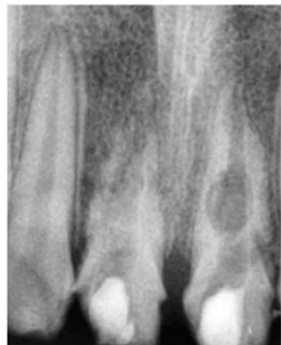
Figura 1. Radiografía inicial.