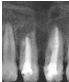
Figura 5. Radiografía final.