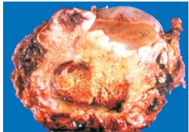
Figura 4. Corte macroscópico que evidencia tumor renal que ocupa 90% de la totalidad del riñón derecho.

1). 3,4 La revisión de la literatura sugiere que los sarcomas osteogénicos metastásicos al riñón son más comunes que los sarcomas primarios. 5 Las lesiones usualmente son asintomáticas, bilaterales, múltiples y generalmente se desarrollan pocos años después del tratamiento primario. 5-7