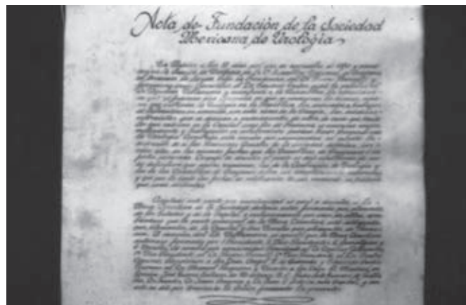
Figura 5. Acta de la Fundación de la SMU

Finalmente la Sociedad Mexicana de Urología queda fundada el 19 de Noviembre de 1936. Se redacta el Acta Constitutiva de la SMU, cuyo