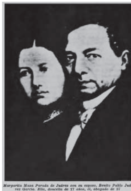
Figura 2. Benito Juárez y Margarita Maza de Juárez