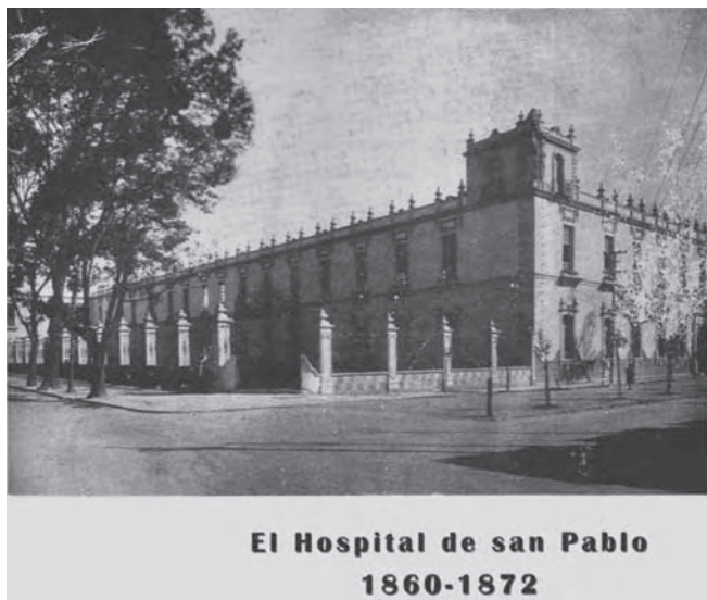
Figura 1. Hospital Juárez de México