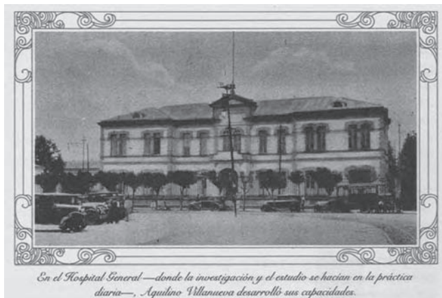
Figura 4. Hospital General de México

Se fundan: la Sociedad Mexicana de Transfusión de la Sangre (hoy se puede escribir trasfusión, sin que sea considerada falta de ortografía). La Sociedad de Traumatología y Ortopedia, el Colegio Indolantino de Cirujanos, la Asociación Nacional de Hospitales. Se instituyó, con la aprobación oficial, que el 6 de enero sea el día de la enfermera.