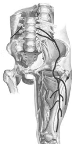
Figura 1. Dibujo anatómico que muestra el origen y recorrido del nervio femorocutáneo lateral.

En muchos casos la meralgia parestética es idiopática. Esta mononeuropatía se presenta en pacientes obesos, durante el embarazo, cirugía pélvica y abdominal, y en personas que utilizan un cinturón apretado, incluso en algunos cirujanos que se alinean contra la mesa quirúrgica por un periodo prolongado 6 También se presentan, en algunos tumores, aneurismas comprimiendo el plexo lumbar proximalmente, posterior a hernioplastia inguinal, trasplante renal, cirugía de cadera, biopsias de médula ósea de la creta ilíaca, cirugía bariátrica laparoscópica y cirugía de corazón. Con frecuencia ocurren comúnmente en pacientes con diabetes y en quienes presentan distensión de la pelvis en la salida del nervio, en donde esta rama puramente sensorial penetra en la pierna. Sin embargo, en la mayoría de los casos se debe al atrapamiento del nervio femorocutáneo lateral con el ligamento inguinal y a la compresión por el uso de separadores, raramente las lesiones son causadas por trauma directo. 4,16-18