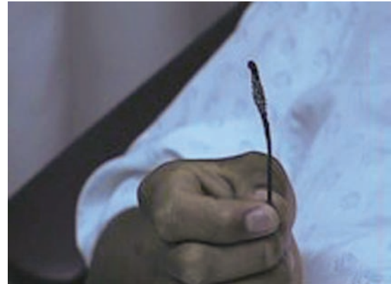
Imagen 2. Varilla metálica extraída.

presentar el individuo disuria persistente y hematuria microscópica ocasional. Debido a la persistencia de los síntomas, un cirujano general descubrió mediante ultrasonido un objeto metálico en la vejiga; el paciente se refirió entonces al urólogo, quien confirmó por endoscopia la presencia de un objeto metálico alargado intravesical que perforaba la vejiga en un extremo y se enclavaba cerca del cuello vesical ( Imagen 1 ). El objeto era una “varilla” metálica de unos 9 cm de longitud, con el extremo distal aplanado y puntiagudo y el proximal romo. Se indujo anestesia general intravenosa suministrada con mascarilla facial y mediante pinza endoscópica por cistoscopia se extrajo el objeto con moderada dificultad por vía transuretral ( Imagen 2 ). El paciente recibió antibióticos, se instaló sonda vesical por 24 horas y la evolución fue satisfactoria.