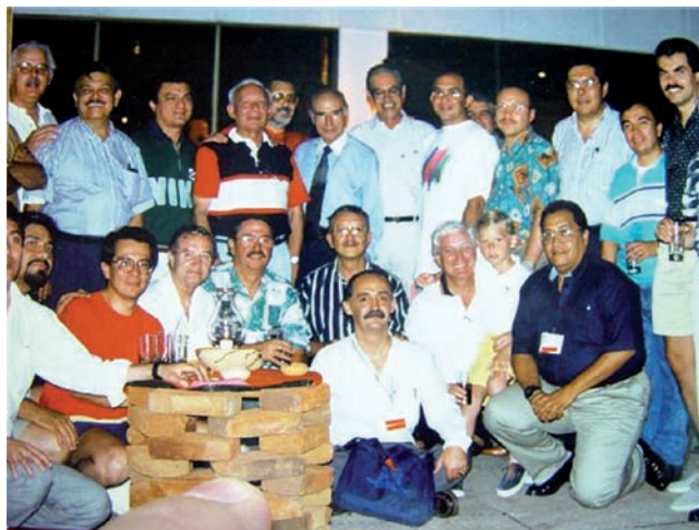
Con colegas urólogos en reunión de la SMU.