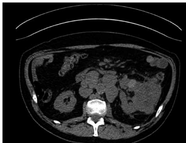
Figura 2. Imagen de tomografía axial computada donde se observa tumor a expensas de riñón izquierdo, así como adenopatías retroperitoneales.

páncreas. Motivo por el cual se realizó nefrectomía radical izquierda con resección multiorgánica (esplenectomía y pancreatectomía distal), y empaquetamiento por sangrado. Siendo desempaquetado a las 72 horas, sin evidencia de sangrado residual o fuga pancreática. El reporte histopatológico fue de carcinoma renal convencional de células claras, Fuhrman 4, con invasión al seno renal, grasa peri-renal, cápsula esplénica y estroma pancreático ( Figura 1 ). El tamaño del tumor era de 15.3 cm localizado en el polo superior y medio, el margen quirúrgico (uréter, arteria y vena renal) fue negativo, el margen quirúrgico del páncreas fue de células neoplásicas en el borde, bazo y glándula suprarrenal izquierda sin alteraciones histológicas.