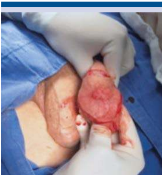
Figura 2. Tumorectomía con bordes amplios.