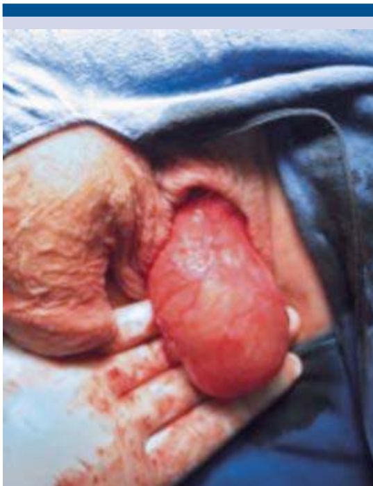
Figura 3. Testículo izquierdo sin afectación macroscópica.

infiltración a la dermis, sin llegar al tejido adiposo.