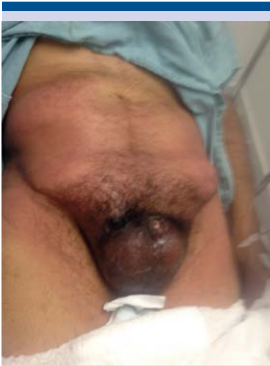
Figura 1. Aspecto clínico del paciente al ingreso hospitalario.