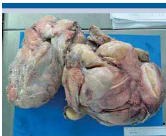
Figura 2. Liposarcoma retroperitoneal (pieza quirúrgica completa, de 56 x 35 x 30 cm y 27 kg).

El informe anatomopatológico definitivo fue de liposarcoma bien diferenciado, con márgenes quirúrgicos negativos (R0) y tumor de 56 x 35 x 30 cm, de 27 kg (Figuras 2 y 3).