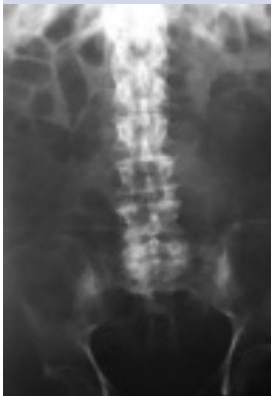
Figura 4. Radiografía de control sin evidencia de gas en la pared vesical. Curación de la cistitis enfisematosa.

Al quinto día de estancia hospitalaria se llevó a cabo un estudio de control radiográfico, sin evidencia de gas en la pared vesical ( Figura 4 ). La evolución del paciente fue satisfactoria, egresando al séptimo día, sin reporte de infección, con condición estable y seguimiento en la consulta externa por el departamento de Urología.