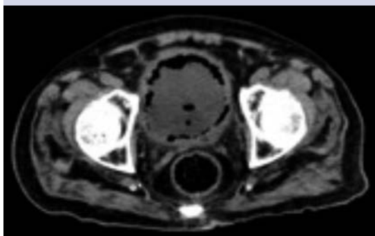
Figura 2. TAC que demuestra abundante gas en la pared vesical.