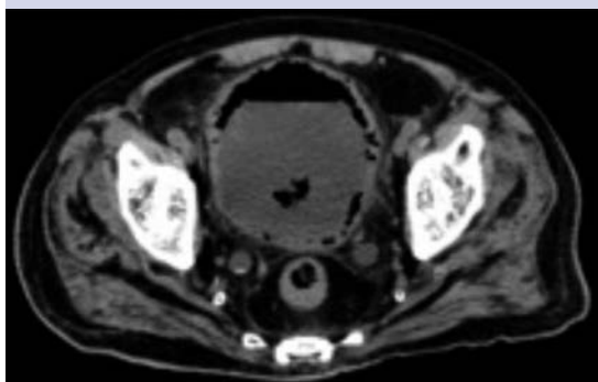
Figura 3. TAC que reporta moderado gas intravesical.

24 horas, de la que drenó piuria, con abundante sedimento y datos de neumaturia. Se inició esquema de antibióticos con imipenem y control metabólico de la diabetes mellitus.