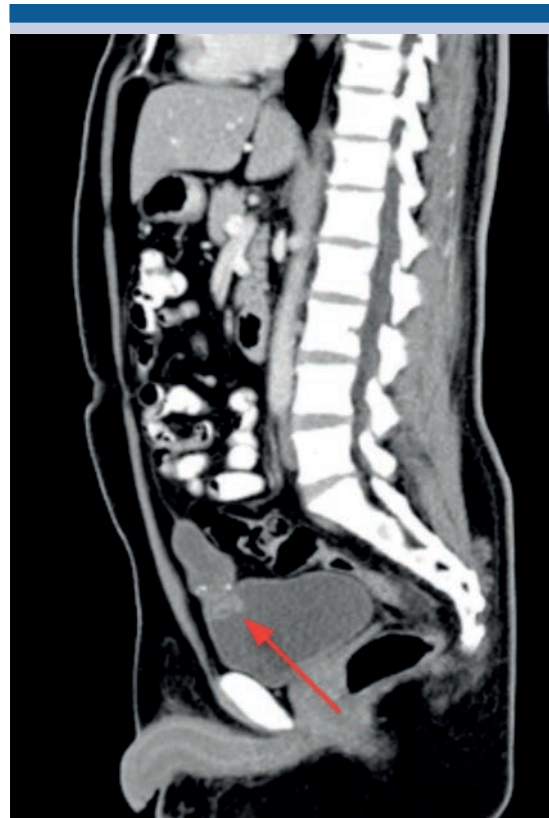
Figura 2. Tomografía contrastada (corte coronal) que evidencia el tumor, con infiltración en el domo vesical.

samiento de la pared y en la línea media la pared anterior con imagen irregular, heterogénea, que