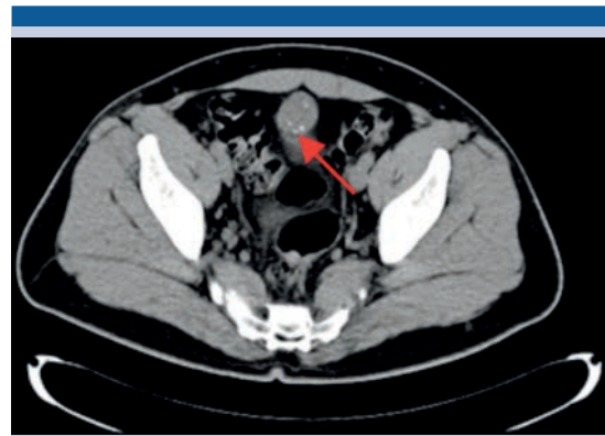
Figura 1. Tomografía (corte axial) que muestra múltiples calcificaciones periféricas puntiformes.

Los estudios de laboratorio reportaron citometría hemática dentro de los parámetros normales; química sanguínea de 3 elementos en ayuno de 8 h con glucemia de 164 mg/dL, urea de 40 mg/dL y creatinina de 1.1 mg/dL. El examen general de orina con glucosuria, proteinuria, hemoglobina (+) y numerosos eritrocitos. El ultrasonido abdominal de vejiga evidenció una imagen lobulada, de contenido heterogéneo adyacente a la pared superior. La tomografía abdominopélvica ( Figuras 1 y 2 ) reportó: retroperitoneo libre de adenopatías, morfología de grandes vasos con diámetro y trayecto normales; en la cavidad pélvica se observó la vejiga urinaria con engro-