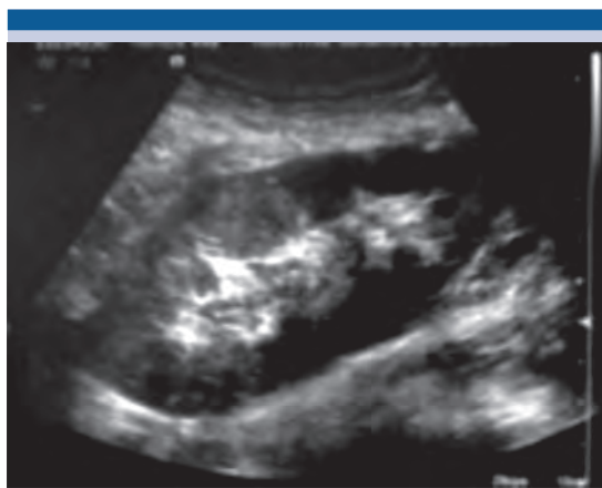
Figura 9. Ultrasonido de control sin evidencia de ectasia renal posterior a la corrección de la estenosis de la unión ureterovesical.

El corte frío con bisturí ha demostrado similar eficacia que la dilatación endoscópica con balón. 19 El paciente que recibió tratamiento