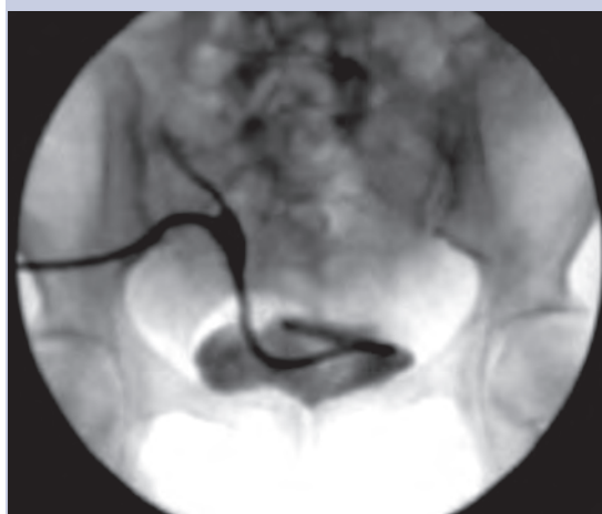
Figura 7. Nefrostografía que muestra el paso de la nefrostomía hasta la cavidad vesical ("cola de cochino" en la cavidad vesical).