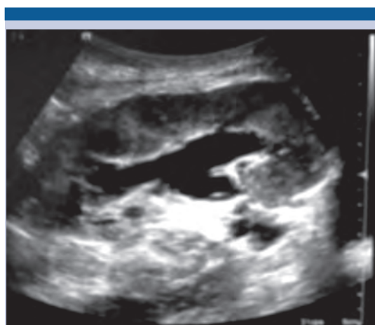
Figura 1. Riñón trasplantado con ectasia.

Paciente masculino de 32 años que recibió trasplante renal de donador vivo relacionado, de 2 años de evolución. El paciente acudió a revisión de rutina, sin manifestación de síntomas clínicos. El análisis de laboratorio reportó creatinina