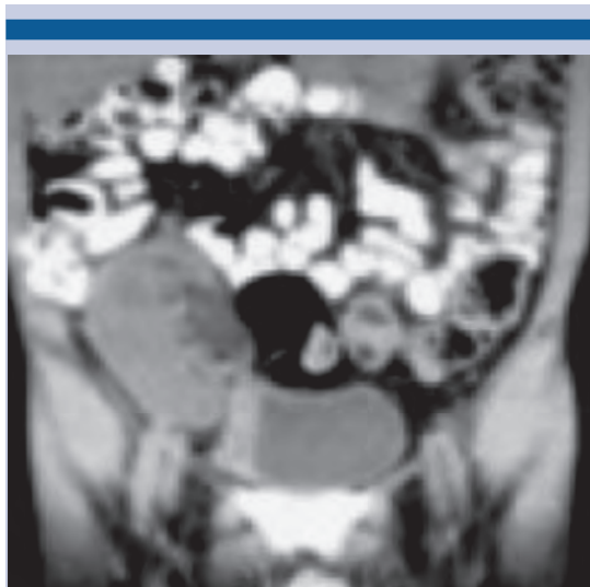
Figura 3. Tomografía que muestra el riñón trasplantado con dilatación ureteropielocalicial.

sérica elevada; el ultrasonido y la tomografía mostraron ectasia renal, por lo que se colocó la nefrostomía. Al igual que el caso anterior, no se apreció el paso del medio de contraste a la vejiga, con pérdida de la progresión en la unión ureterovesical. El tratamiento consistió en ureterotomía con corte frío y colocación de un catéter ureteral doble J. Figuras 3, 4 y 5.