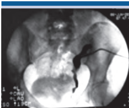
Figura 2. Nefrostografía de riñón trasplantado, sin paso del medio de contraste hacia la vejiga; solo se observa el paso a la unión ureterovesical.

sérica elevada; el ultrasonido y la tomografía mostraron ectasia renal, por lo que se colocó la nefrostomía. Al igual que el caso anterior, no se apreció el paso del medio de contraste a la vejiga, con pérdida de la progresión en la unión ureterovesical. El tratamiento consistió en ureterotomía con corte frío y colocación de un catéter ureteral doble J. Figuras 3, 4 y 5.