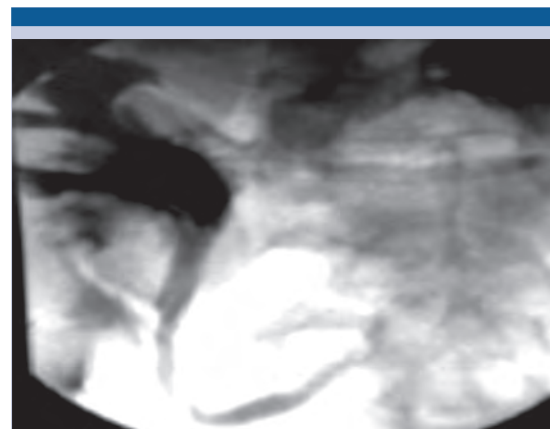
Figura 5. Nefrostografía sin paso del medio de contraste hacia la vejiga y con dilatación pielocalicial.