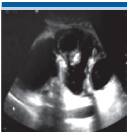
Figura 8. Riñón trasplantado con ectasia.

Paciente femenina de 36 años, con trasplante renal de donador vivo relacionado, quien acudió a consulta por dolor en el hueco pélvico y elevación de azoados. El ultrasonido y la tomografía mostraron dilatación de las cavidades del riñón trasplantado. Se realizó ureterotomía con láser Ho-YAG y se le colocó un catéter J. Figura 8.