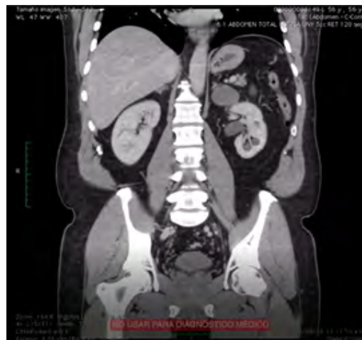
Imagen 3. Corte coronal de tomografía en fase contrastada, mostrando masa suprarrenal izquierda homogénea y bien circunscrita (flecha).

El estudio histopatológico reportó pieza quirúrgica macroscópica de aspecto nodular, cubierto de tejido adiposo, de 60 gr, con dimensiones 6.5 x 5.0 x 2.3 cm, en una de sus superficies se muestra trabeculada y de color amarillo, el resto de color liso grisáceo con áreas amarillentas, al corte se expone superficie homogénea y blanquecina; el aspecto microscópico (Imagen 4) reporta glándula suprarrenal con proliferación de células fusiformes a nivel de la médula adrenal, núcleos de cromatina fina, sin figuras mitóticas atípicas, inmersas en estroma fino, fibrilar y eosinófilo, con grupos de células ganglionares maduras, sin invasión capsular, lo cual corresponde a ganglioneuroma suprarrenal (6.5 x 5 cm).