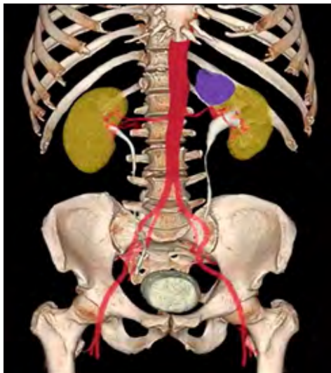
Imagen 1. Reconstrucción 3D de TAC, donde se aprecia tumoración suprarrenal izquierda (marcada de color azul).

se egresó al segundo día posterior a cirugía por mejoría.