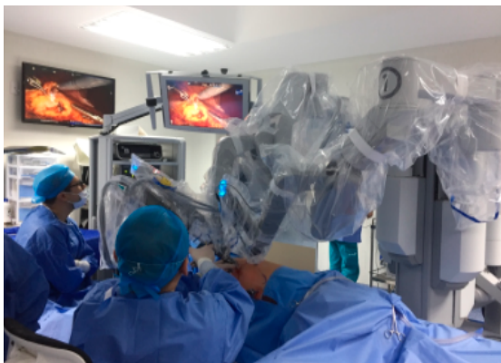
Figura. 1. Abordaje robótico y laparoscópico transvaginal para nefrectomía derecha, con el uso de 2 trócares robóticos y 2 trócares accesorios, uno de ellos transvaginal y uno abdominal.

Se profundizó hasta ingresar a la altura del hilio renal, identificando arteria renal y vena renal y colocando en arteria renal dos hemio-locks proximales y uno en el extremo de la pieza cortando entre este y los proximales. Se realizó mismo clipaje en ambos troncos venosos principales y uréter (Figura 2).