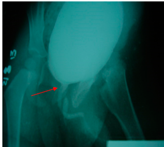
Figura 2. Vejiga de buena capacidad con evidencia de uretra accesoria que desemboca a la región perineal

Al obtener los resultados de todos estos estudios se decide realizar tratamiento quirúrgico cuyo procedimiento se llevó a cabo colocando al paciente en posición de litotomía, posteriormente se pasa un fino catéter 8fr por la pequeña pápula localizada a nivel perineal; mediante la cistoscopia se evidencia la presencia del catéter en la vejiga y por vía perineal permitió hacer una disección hasta la base de la vejiga y ligar sin dificultad. La evolución fue satisfactoria y se comprobó el éxito con la evolución del paciente que no presentó sintomatología urinaria de ninguna índole. Se realizó uretrocistografía comprobatoria no demostrándose salida de orina por ningún trayecto uretral. El niño se mantiene sin presentar sintomatología urinaria irritativa.