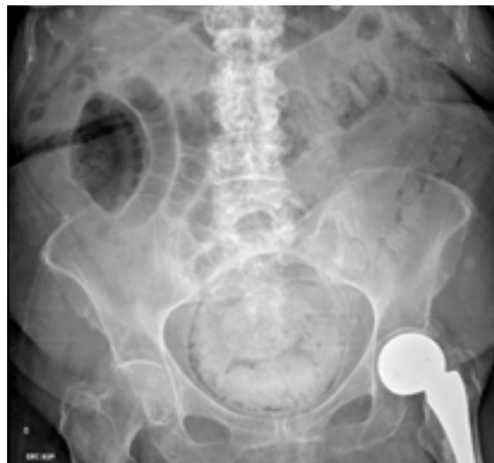
Figura 1. Radiografía simple de abdomen

Se visualiza radiolucencia en téorica pared vesical compatible con gas, que se encuentra ampliamente repleccionada y un gran fecaloma.