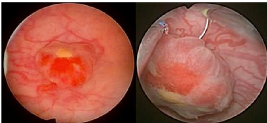
Figura 2. Cistoscopia con evidencia de lesión de 1.7 cm en el fondo vesical, nodular, sangrante

El resultado de patología es un tumor de vejiga de 1.7x1.1x0.3 cm, en donde se observan fragmentos nodulares de una neoplasia epitelial maligna, constituida por células medianas a grandes con abundante cantidad de citoplasma claro, núcleos hipertróficos y moderadamente pleomórficos,