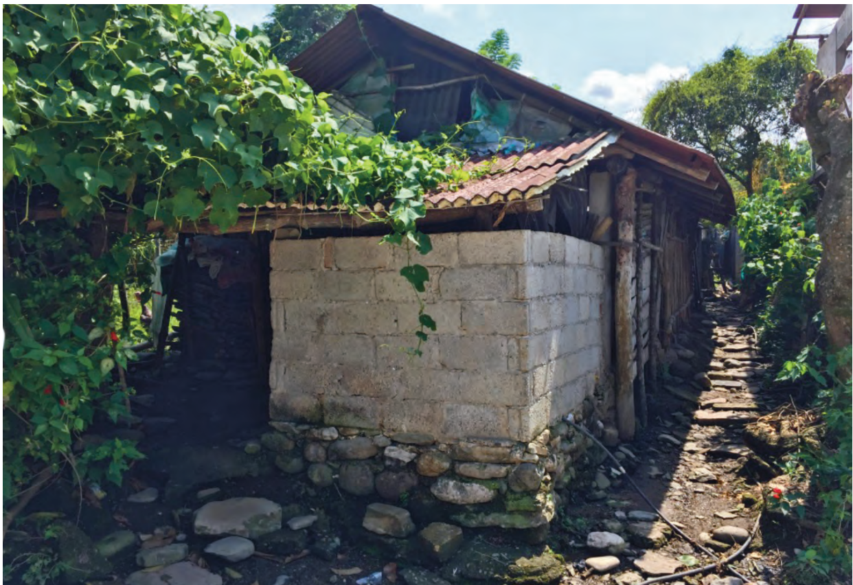
Figura 3.- Materiales de construcción en las casas de san Antonio Rayón, Puebla.