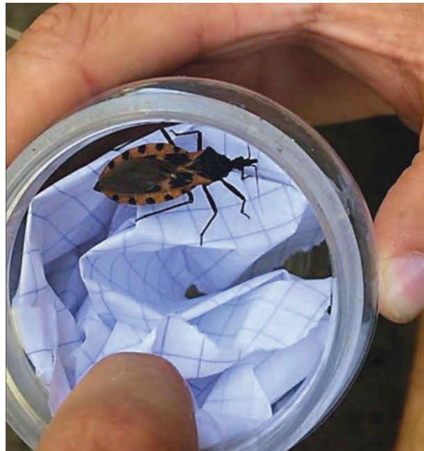
Figura 4.- Ejemplar hembra de Triatoma dimidiata colectado en San Antonio Rayón en el intradomicilio.

Por ello, se realizó xenodiagnóstico indirecto; aunque ambas pruebas presentan una sensibilidad baja se prefirió aumentar la probabilidad de ensayos. En este caso se pudo constatar la presencia del mismo en las ninfas de Triatoma dimidiata de la colonia de laboratorio, aspecto poco frecuente en este tipo de estudios, debido a consideraciones éticas sobre el manejo de la prueba directa. Lo anterior demuestra la necesidad de utilizar todas las pruebas y procedimientos posibles, pues la excelencia diagnóstica de las reacciones cadena polimerasa (PCR) no dejan de ser tardadas, costosas, y erráticas en algunos casos. Abra et al. (2018).