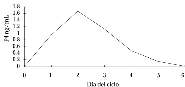
Figura 2. Niveles de progesterona en las ovejas que presentaron luteólisis prematura.

presentaron cuerpos lúteos con regresión prematura, ésta ocurrió al día 3.7 postestro ( 3.75 \pm 0.75 ). En contraste, en las donadoras con cuerpos lúteos normales, los niveles de P4 se mantuvieron superiores a 1 ng/mL hasta el día 6 en que se recolectaron los embriones.