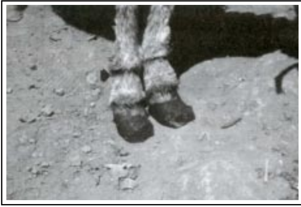
Figura 4. Cascos de burro cortados con un machete. (La flecha indica cicatrices en piel por cuerdas apretadas que se usan para maniar a los animales).

meses, sería imposible para los dueños, además inconveniente por la resistencia que desarrollan los parásitos a los vermífugos. Se están llevando a cabo estudios evaluando varios calendarios de desparasitación, con el fin de proponerle al campesino alternativas económicas para el tratamiento antihelmíntico.