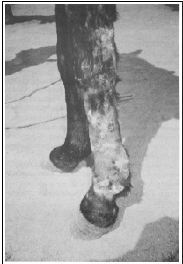
Figura 3. Mano de un burro con lesiones de linfangitis ulcerativa "gálico" de donde se ha aislado Mycobacterium avium .

Otro de los grandes problemas encontrados en los animales del campesino de pocos recursos es la parasitosis intestinal. Tratar de resolverla en forma tradicional, recomendando una desparasitación cada 2 o 3