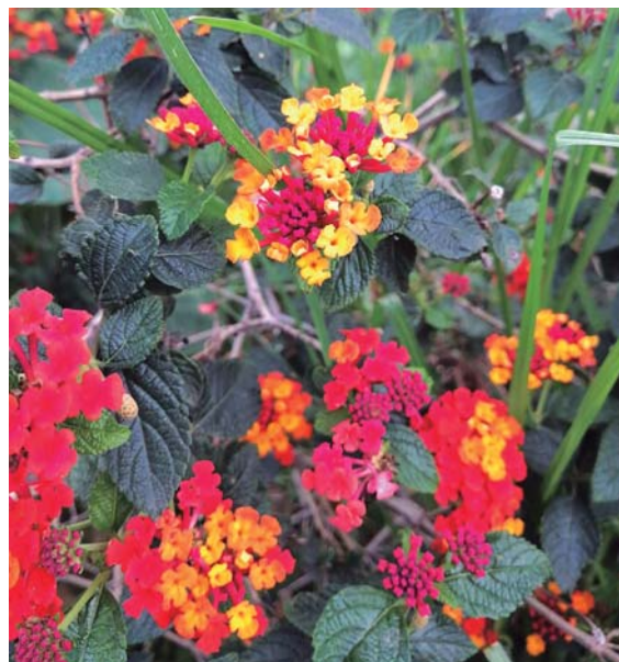
Figura 3. Lantana camara .

hecho que comprobamos encontrando valores muy elevados de SGOT, de bilirrubina y al observar las lesiones histológicas.